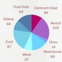
Wijk- en dorpsverdeling